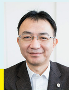
弁護士／弁理士 札幌弁護士会 知的財産委員会委員長