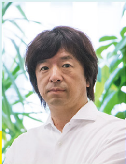
クリプトン・フューチャー・ メディア株式会社 代表取締役

これらコンテンツビジネスや知的財産権の考え方について理解を深めるのが、今回の主なテーマです。北海学園大学・札幌弁護士会の共催による本セミナーの開催を通じて、企業法務に関わる実務家や専門家はもとより、知的財産戦略や、知的財産法務に関心のある幅広い層の方々に「知的財産権」の面白さ奥深さをお伝えします。