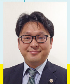
北海学園大学法学部教授 弁護士