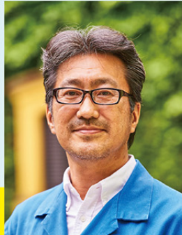
株式会社スタジオジブリ 代表取締役社長