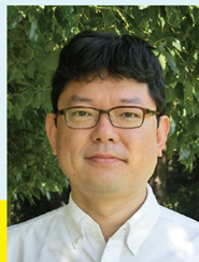
株式会社スタジオジブリ 総務部 部長